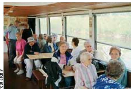
Seniory z klubu v Javoříčské ulici se svezli lodí po Batově kanálu.