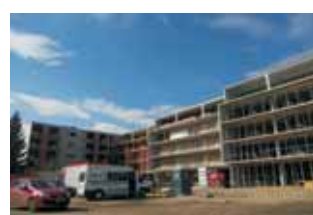
JEDINEČNÝ VÝHLED NA CENTRUM MĚSTA