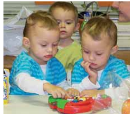
Dvojčata mohou znamenat kromě radosti i více starostí. V centru poradí, jak na ně.

asistované reprodukce,“ vysvětluje manažerka centra. (lop)